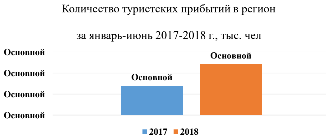
Рис. 1. Сравнительный анализ количества туристских прибытий в регион

Согласно мнению Н.Н. Даниленко, несомненно, нужно ориентироваться на культурные особенности китайцев в части питания и гостиничного обслуживания (наличие персонала, говорящего на китайском языке, термосы с горячей водой и пакеты чая в соответствии с вкусами китайских туристов). Развитие туризма предполагает развитие соответствующей инфраструктуры, например, осуществление безналичных платежей китайскими банковскими картами. Администрация Иркутска придется решать вопрос о модернизации туристической инфраструктуры для туристов, говорящих на китайском языке. Пребывание в Иркутске должно стать комфортным для китайских граждан [1, с. 83].